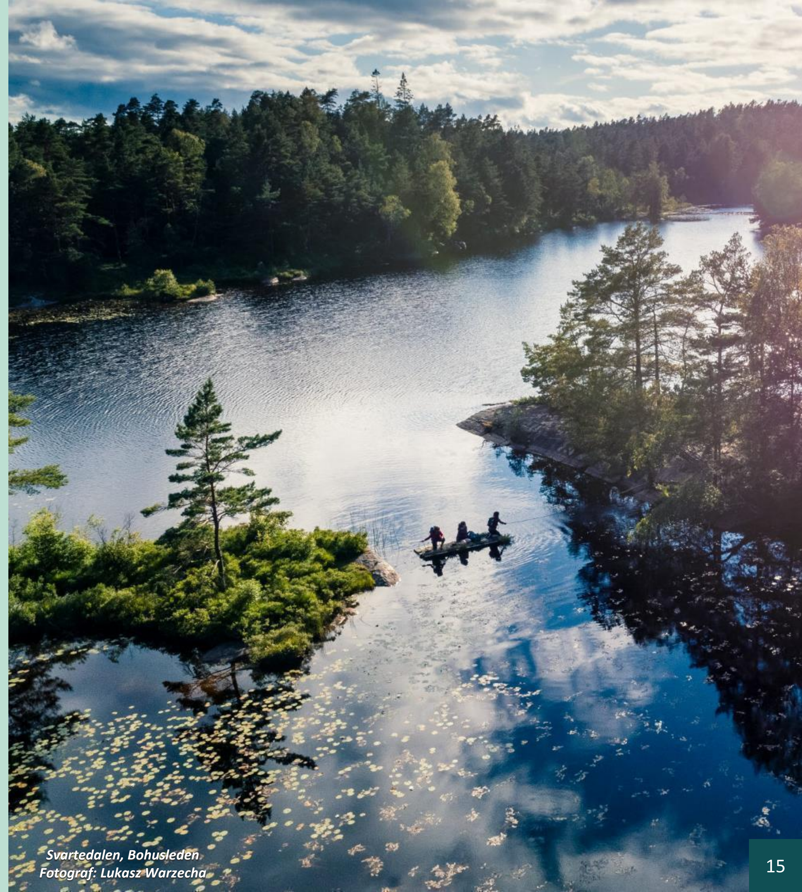
Svartedalen, Bohusleden

En led får gärna ha ett utvecklat tema som lyfter fram områdets historia eller erbjuder besökarna andra värden. I dessa fall kan det finnas ytterligare tematiska ska-krav att förhålla sig till, t.ex. kan Pilgrimsleder ha krav på historisk koppling och platser för andliga upplevelser längs leden.